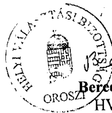
Berecz Lászlóné Berecz Lászlóné HVB elnöke